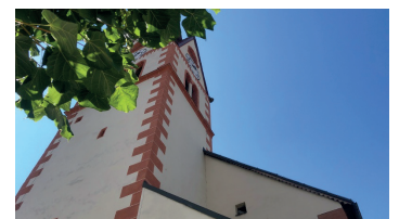
Markuskirche, Bergsteigerdorf Mauthen