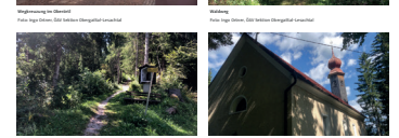
Markuskirche, Bergsteigerdorf Mauthen